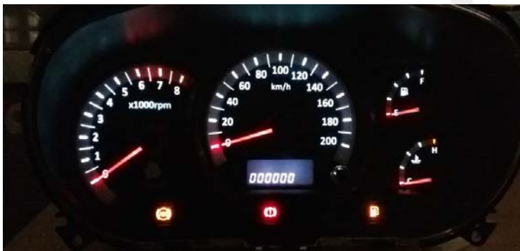
میزان روشنایی در بیشترین حالت