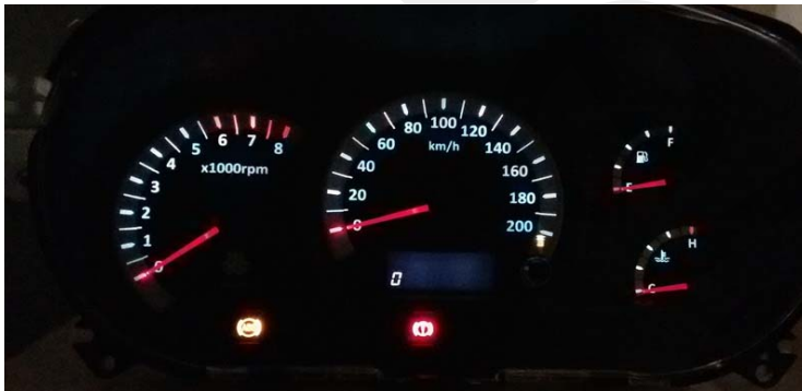
میزان روشنایی در کمترین حالت